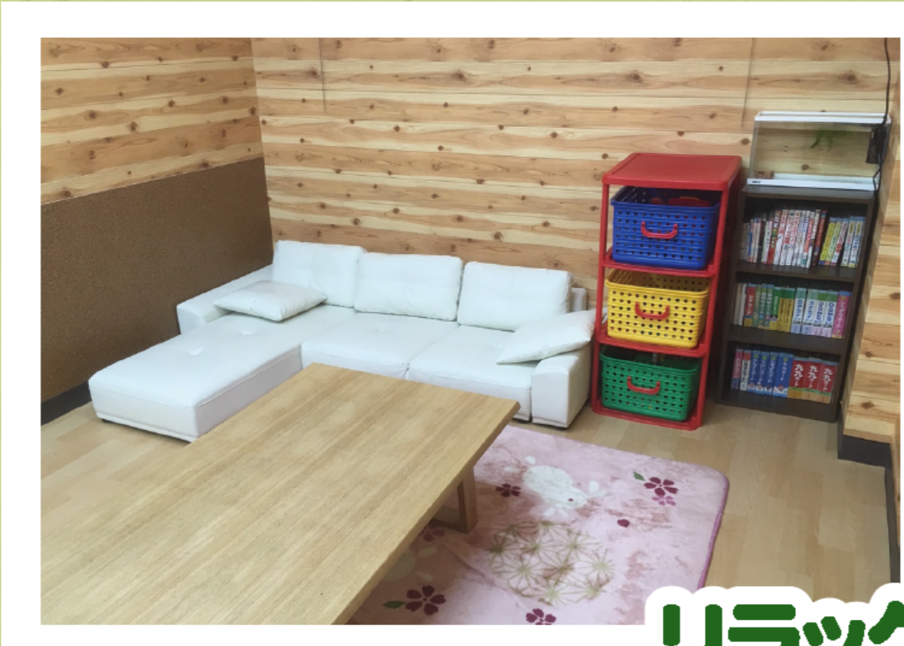
リラックスコーナー