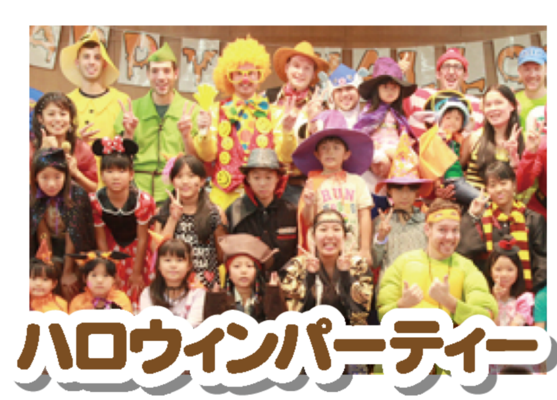
ハロウィンパーティー