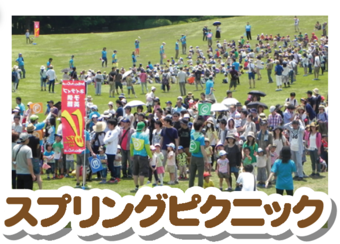
スプリングピクニック