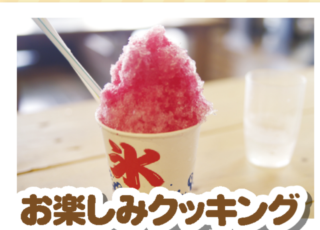
お楽しみクッキング